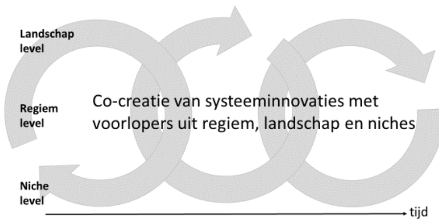
Figuur 2 Transitieprocessen op basis van co-creatie

Door co-creatie als organiserend principe van transitieprocessen te erkennen ontstaat een nieuw transitiepad naast de paden die Schot en Geels beschrijven. Hun transitiepaden zijn gebaseerd op de wederzijdse beïnvloeding van regiem, landschap en niches op basis van ieders eigen belang. Bij co-creatie werken voorlopers uit regiem, landschap en niches (gericht) samen aan systeeminnovaties. Voorlopers zijn niet alleen niche spelers, maar zijn vaak ook juist onderdeel van spelers in het regiem (bijvoorbeeld vernieuwende onderdelen in ondernemingen) en in het landschap (zoals projecten van NGO's en overheden). Zo ontstaat een transitiepad op basis van co-creatie dat de verschillende levels verbindt in plaats van scheidt op basis van hun diversiteit. Voorlopers in niches, regiem en het landschap vinden elkaar omdat ze weten dat ze afhankelijk van elkaar zijn om het beste voor ieder van hen en voor het geheel te realiseren.